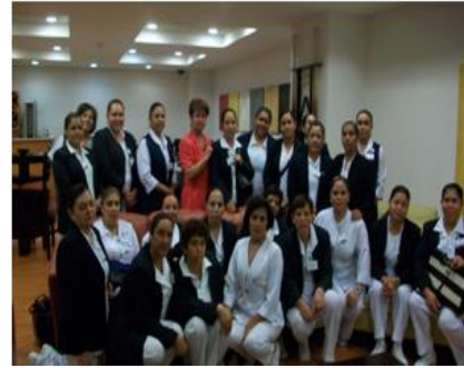
Especialidad de Enfermería en Administración y Docencia

requerimientos de atención de la población Zacatecana: como son los siguientes: Especialidad en Enfermería en Salud Pública, Especialidad Enfermería Quirúrgica y Especialidad en Enfermería Administración y Docencia; cubriendo las demandas de formación de personal insertos a las instituciones de salud, y a la superación profesional del personal de enfermería.