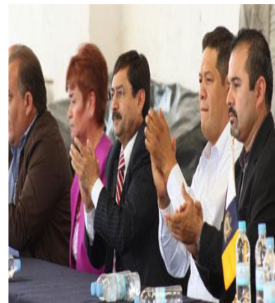
Inauguración Juan Aldama

De esta manera la Unidad Académica de Enfermería genera condiciones y mecanismos, que contribuyen a que más jóvenes ingresen a la universidad acercando los programas académicos a los municipios del estado, con el finalidad de ofrecer más oportunidades de progreso y desarrollo regional.