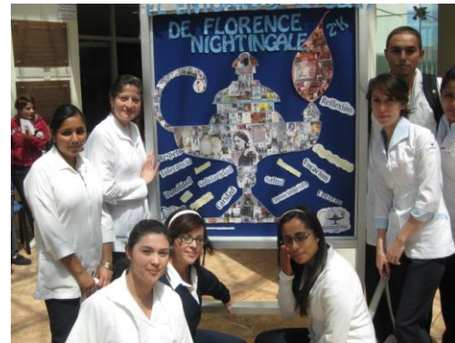
Jornada Internacional de Lectura Ininterrumpida de las notas sobre Enfermería de Florence Nightingale.

Se apoya para la realización de actividades deportivas, tanto dentro de la unidad académica como de la universidad, este apoyo consiste en la compra de uniformes deportivos. Algunos alumnos forman parte de la selección que representa la Universidad Autónoma de Zacatecas, donde se han obtenido premios de segundo y tercer lugar tanto a nivel regional como nacional.