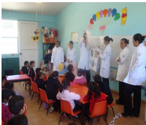
Alumnos en práctica comunitaria

Enfermería acreditado por CIEES y COMACE, continua en permanente reestructuración de acuerdo al Modelo UAZ Siglo XXI.