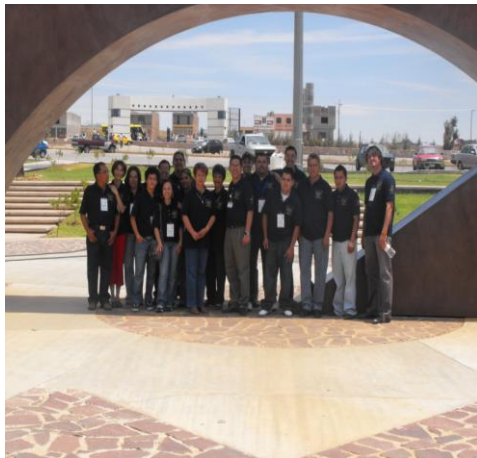
Personal docentes y estudiantes que participaron en la aplicación del Examen CENEVAL

Los alumnos asisten regularmente a sus clases teóricas, prácticas en laboratorio, hospitales, centros de salud, comunidad, estancias infantiles y casa hogar para ancianos, parte importante de una formación integral.