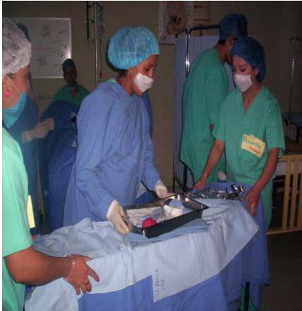
Alumnas de la Posgrado en Prácticas Quirúrgicas