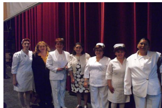
Personal Docente en Ceremonia de Graduación Generación 2010.