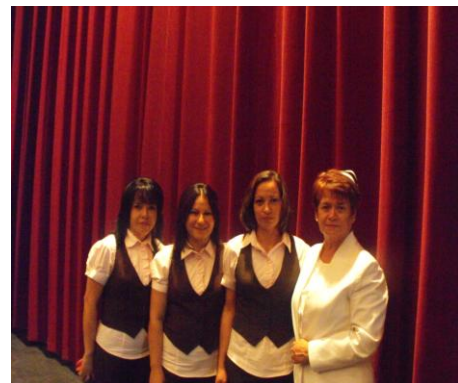
Personal Administrativo y la Directora

Se realizaron cursos de actualización y capacitación con la participación de algunos