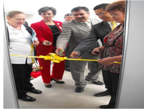
Inauguración del Consultorio Tierra y Libertad