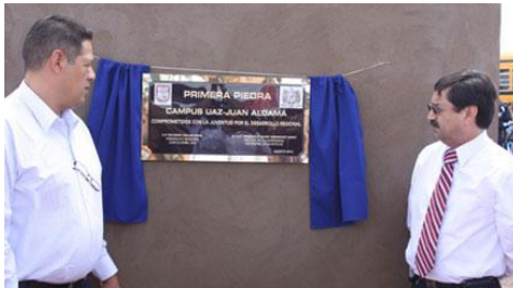
Primera piedra del Campus Juan Aldama

La SEDE se encuentra en el colegio del centro Fray Martín de Valencia, quienes facilitaron los espacios mientras se construye el Campus Universitario.