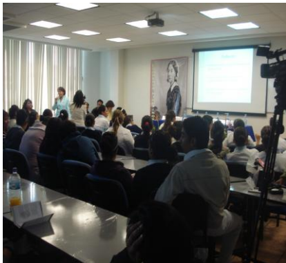
Jornada Internacional de Lectura Ininterrumpida de las notas sobre Enfermería de Florence Nightingale.

Se realizó evento de Lectura Ininterrumpida de “Las Notas sobre Enfermería” de Nightingale. Los participantes se comprometieron en realizar un acto público para dar lectura de un pasaje de la obra de Florence Nightingale.