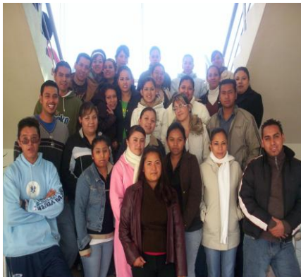
Alumnos de la Unidad Académica de Enfermería

Se realizan reuniones periódicas con los jefes de grupos, con la finalidad del análisis de problemáticas existentes con alumnos y valorarlas con estrategias, al igual se realizan visitas a los salones con los alumnos para tener una relación directa no solo con los líderes de los grupos sino con todos los alumnos.