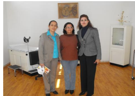
Consultorio Tierra y Libertad