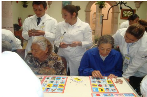
Alumnos en el Asilo de Ancianos

Al concluir su programa académico realizan servicio social en las diferentes instituciones de salud.