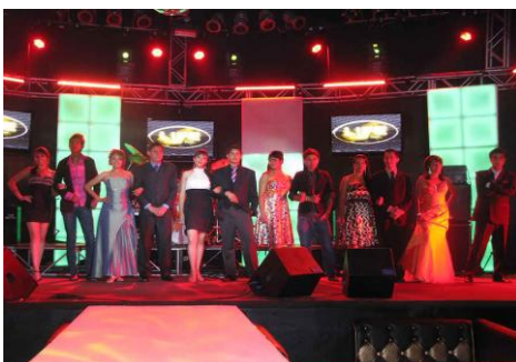
Reina del estudiante de la Unidad Académica de Enfermería

Todo lo anterior se realizó en conjunto con las autoridades de la Unidad Académica de Enfermería.