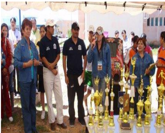
Entrega de premios

deportivas: maratón yoga fútbol basquetbol, voleibol, caminata y aficionados a karaoke. Todas ellas llevadas a cabo en la Unidad Deportiva Norte como en las instalaciones campo UAZ SIGLO XXI.