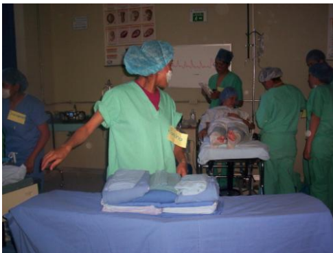
Alumnas de la Posgrado en Prácticas Quirúrgicas