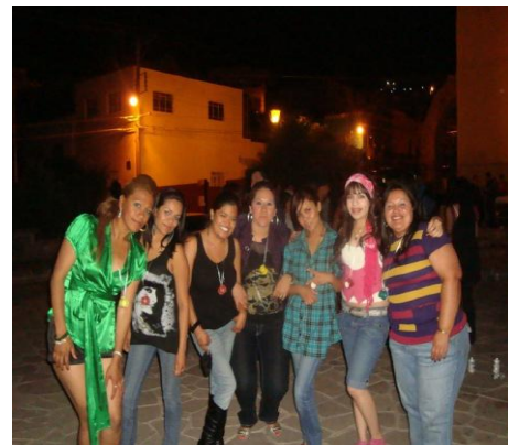
Plaza 450, Callejoneada

Todo lo anterior se realizó en conjunto con las autoridades de la Unidad Académica de Enfermería.