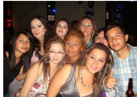
Actividad que se realizó en Life Concert Hall

Se realizó una tradicional callejoneada por las principales calles del centro histórico de la ciudad para dar cierre a las actividades conmemorativas del día del estudiante de la Unidad Académica de Enfermería 2010, la que culminó en la plaza 450 con una taquiza.