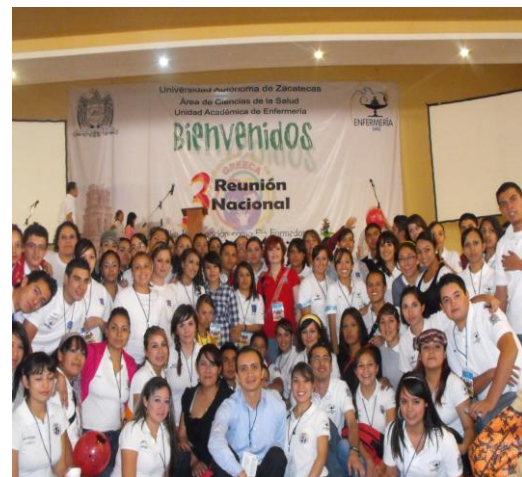
Bienvenida 3ª Reunión Nacional GRECA

Por lo anterior a través del grupo de investigación “la enfermería y la prevención de adicciones”, tuvo el privilegio de ser sede de la Tercera Reunión Nacional de estudiantes de enfermería contra las adicciones (GRECA) con el objetivo de realizar un análisis sobre el incremento en el uso de las drogas, sensibilizar a los estudiantes universitarios de enfermería en contra del uso de sustancias adictivas y fomentar acciones que promuevan conductas y estilos de vida saludables y compartirlos con sus pares en los ámbitos intra y extra universitarios. Con el tema central “LA INVESTIGACION COMO EJE FORMADOR EN LA PREVENCIÓN DE ADICCIONES” la cual tuvo fecha ), los días 29 y 30 de septiembre y 1º de octubre de 2010, participación de conferencistas de reconocimiento internacional,