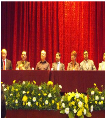
Inauguración de Actividades en Nochistlan

En Nochistlan se inaugura en fecha 9 de agosto de 2010 la matrícula es de 34 alumnos de primer semestre, siendo la SEDE en el centro de rehabilitación del DIF. En tanto se construye el Campus.