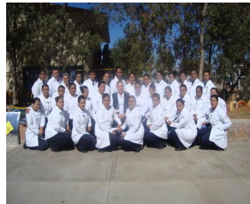
Alumnos en su docente en práctica de Enfermería Comunitaria

La Universidad Autónoma de Zacatecas a través de la Unidad Académica de Enfermería coadyuva con el sector salud en la profesionalización de los Auxiliares de enfermería al ofertar el programa académico de Técnico en Enfermería General, lo que permite elevar la calidad en el cuidado al paciente otorgado por el personal de enfermería.