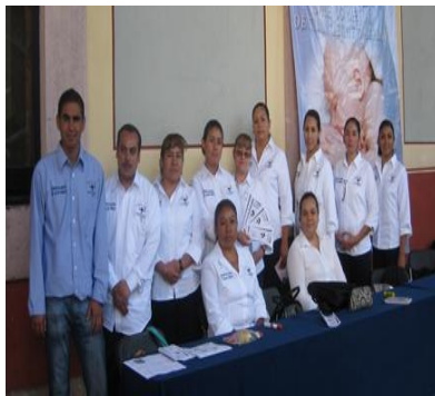
Alumnas de Posgrado

Dentro de las actividades académicas fue la de una estancia de 15 días en la ciudad de San Luis Potosí, Unidad de Investigación en Salud y Primaria